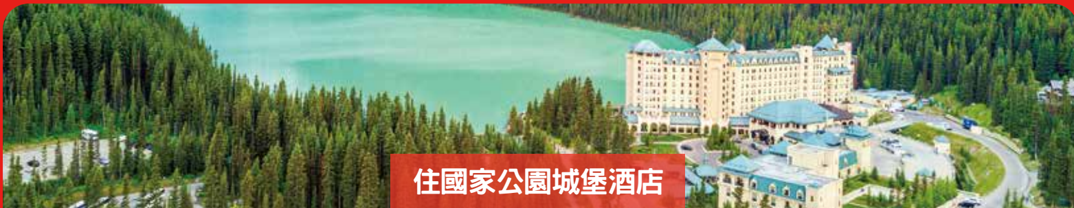
住國家公園城堡酒店