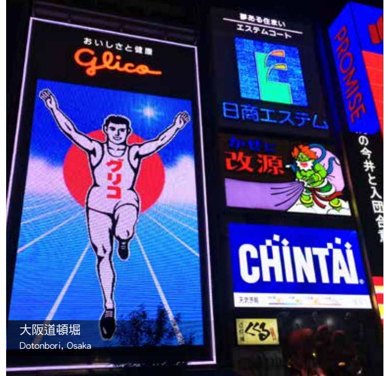
大阪道頓堀 Dotonbori, Osaka