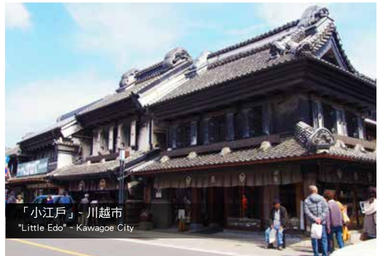
「小江戸」~ 川越市 "Little Edo" ~ Kawagoe City