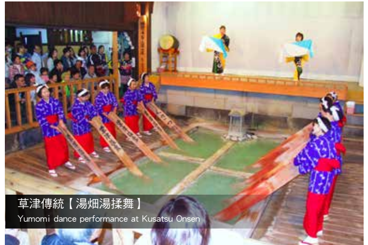
草津傳統【湯畑湯揉舞】 Yumomi dance performance at Kusatsu Onsen

高崎少林山達磨寺 → "小江戸" 川越市 → 免稅店 → 東京晴空塔 ~ 晴空街道商店街 Takasaki Shorinzan Darumaji → "Little Edo": Kawagoe City → Duty Free Shop → Tokyo Skytree Shopping Plaza 🏨 Candeo hotel chain or similar