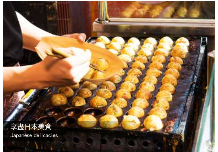
享盡日本美食 Japanese delicacies